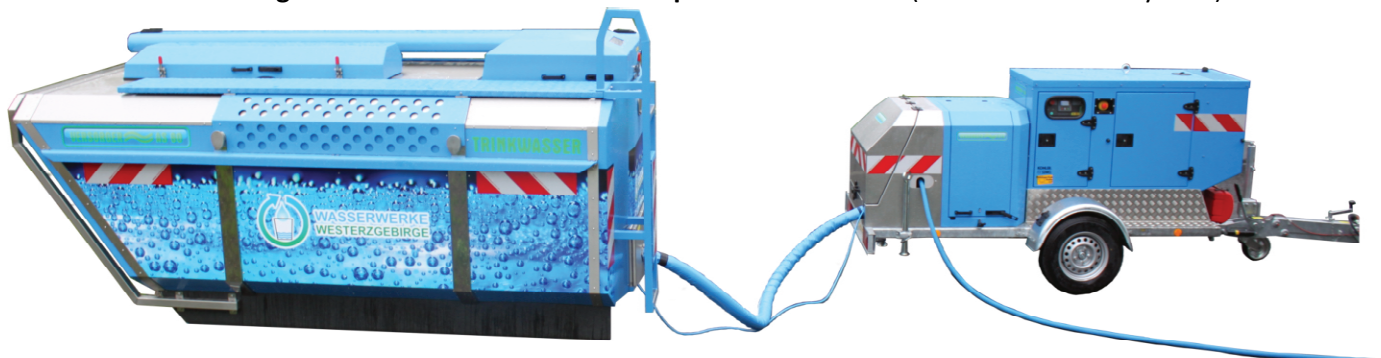
Bild unten: KTS mit angeschlossenem Trinkwassertransportbehälter AS 60 (Containerwechselsystem)